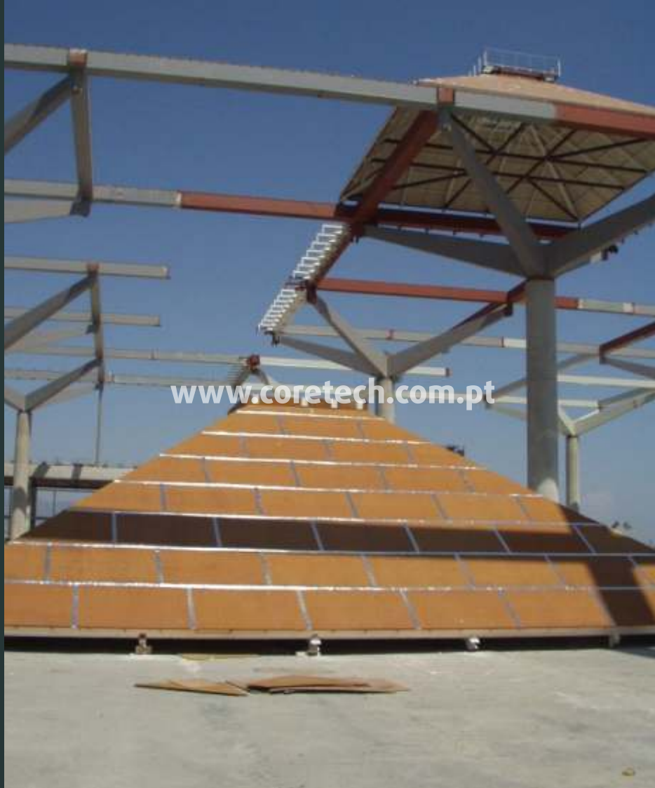
Cobertura do aeroporto de Málaga